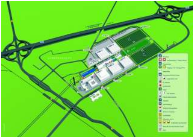
Anfahrtsplan Leipziger Messe